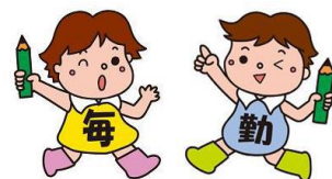
毎月勤労統計調査のキャラクター「まいちゃんきんちゃん」

https://www.pref.yamaguchi.lg.jp/cms/a12500/tingin/maikin.html