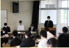
生徒総会での行動宣言