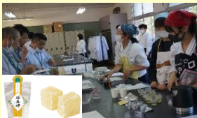
規格外の農産物であるユズキチを利用した食品開発