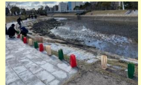
まじめ川ミズベリングキャンドルナイト