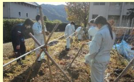
山口市の伝統野菜 ヤマノイモの栽培