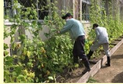
緑のカーテンの制作