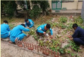
「環境に優しいサツマイモ」の栽培