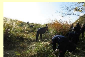
秋吉台の火道切り