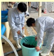
磯焼け問題に関する調査