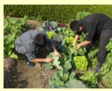
無農薬栽培に関する研究