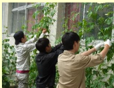
緑のカーテンの制作