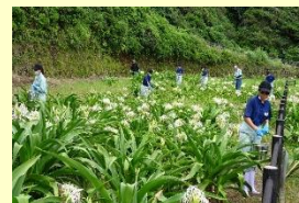
ハマユウの保護活動