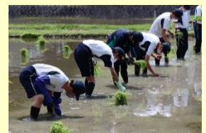
田植え行事「さのぼり」