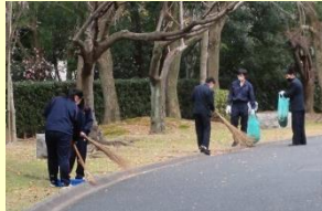
高校生地域環境ミーティング