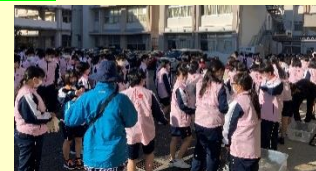
幸せますまちづくり運動