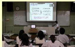
ペットボトル回収事業講演会