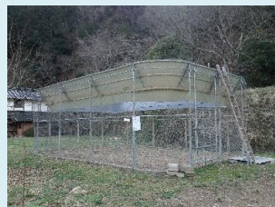
サル捕獲用大型囲いわなによる捕獲