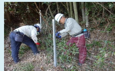
侵入防止柵の補修