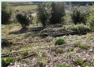
繁茂竹林を伐採し緩衝帯整備

○令和元年度は、防護柵が未設置の隣接集落との境界に侵入防止柵を設置し、イノシシの侵入防止を図った。