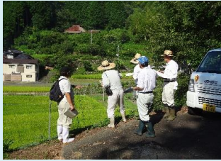
集落環境調査の実施