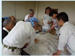
調査結果をもとに被害マップを作成