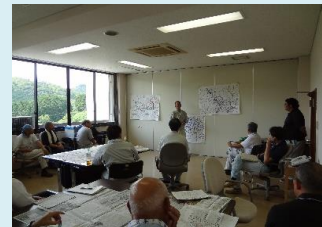
各班から結果発表、意見交換