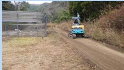
囲いわなの適正管理