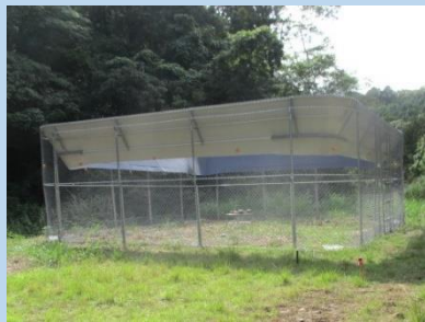
大型囲いわなの設置