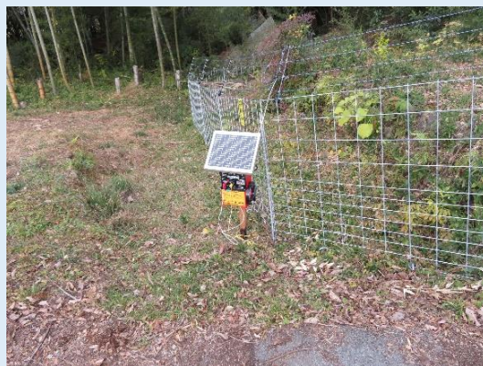
[イノシシ・サル侵入防止柵]