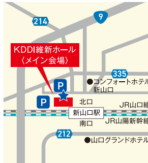
① KDDI維新ホール ★シャトルバス乗り場