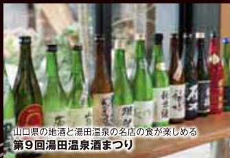
山口県の地酒と湯田温泉の名店の食が楽しめる 第9回湯田温泉酒まつり