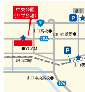
② 中央公園 ★シャトルバス乗り場