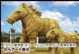
「わらの動物園」をテーマに山口市ゆかりの動物を制作 わらアート展示