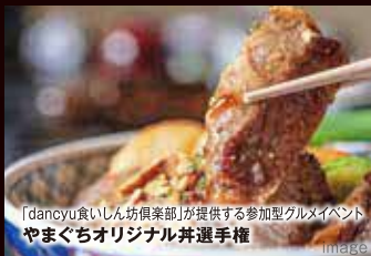
「dancyu食いしん坊倶楽部」が提供する参加型グルメイベント やまぐちオリジナル井選手権