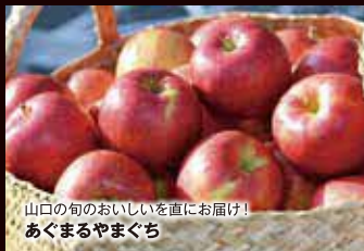
山口の旬のおいしいを直にお届け! あくまるやまぐち