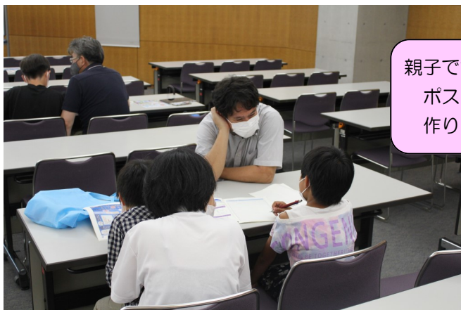
親子で協力して ポスターを 作りました