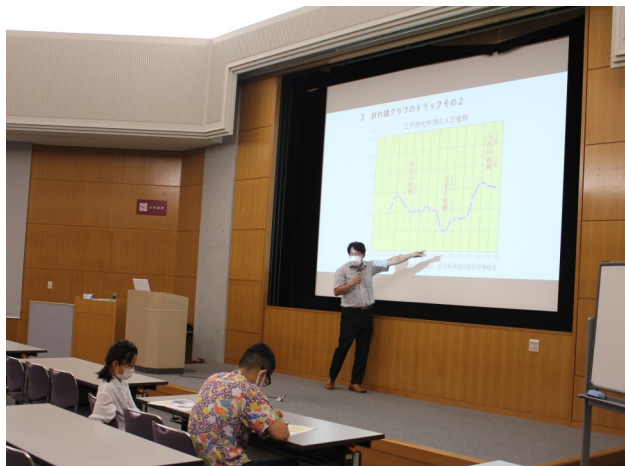
高学年は少し難しいことも勉強しました