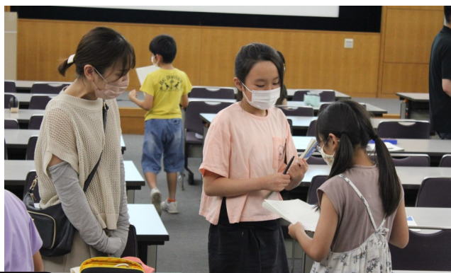
みんなに質問しました