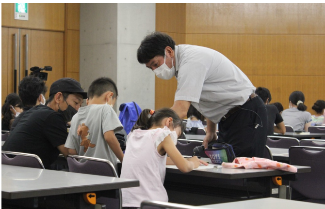
親子で一緒に勉強します

午前の部には、22組40人の児童とその保護者の方が参加しました。自己紹介をしてグラフの気付きを発表したり、自分で絵グラフを作る練習をしました。