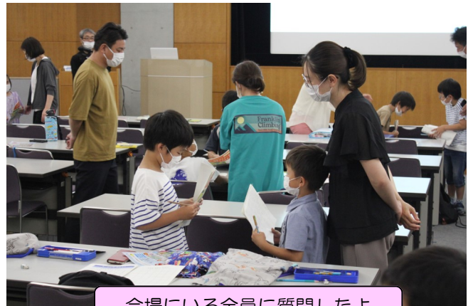
会場にいる全員に質問したよ