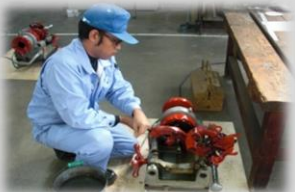
鋼管のねじ切りと継手の接続体験