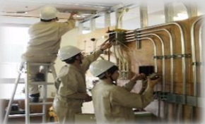
結線、点灯などの電気配線作業体験