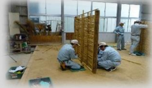
植栽、竹垣作成体験