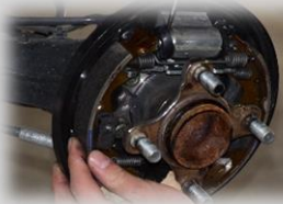
ブレーキ装置の点検体験