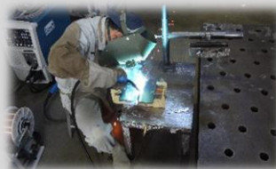
鋼板の溶接体験 (指導員介添え)