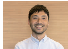
株式会社ヨシダキカク 代表