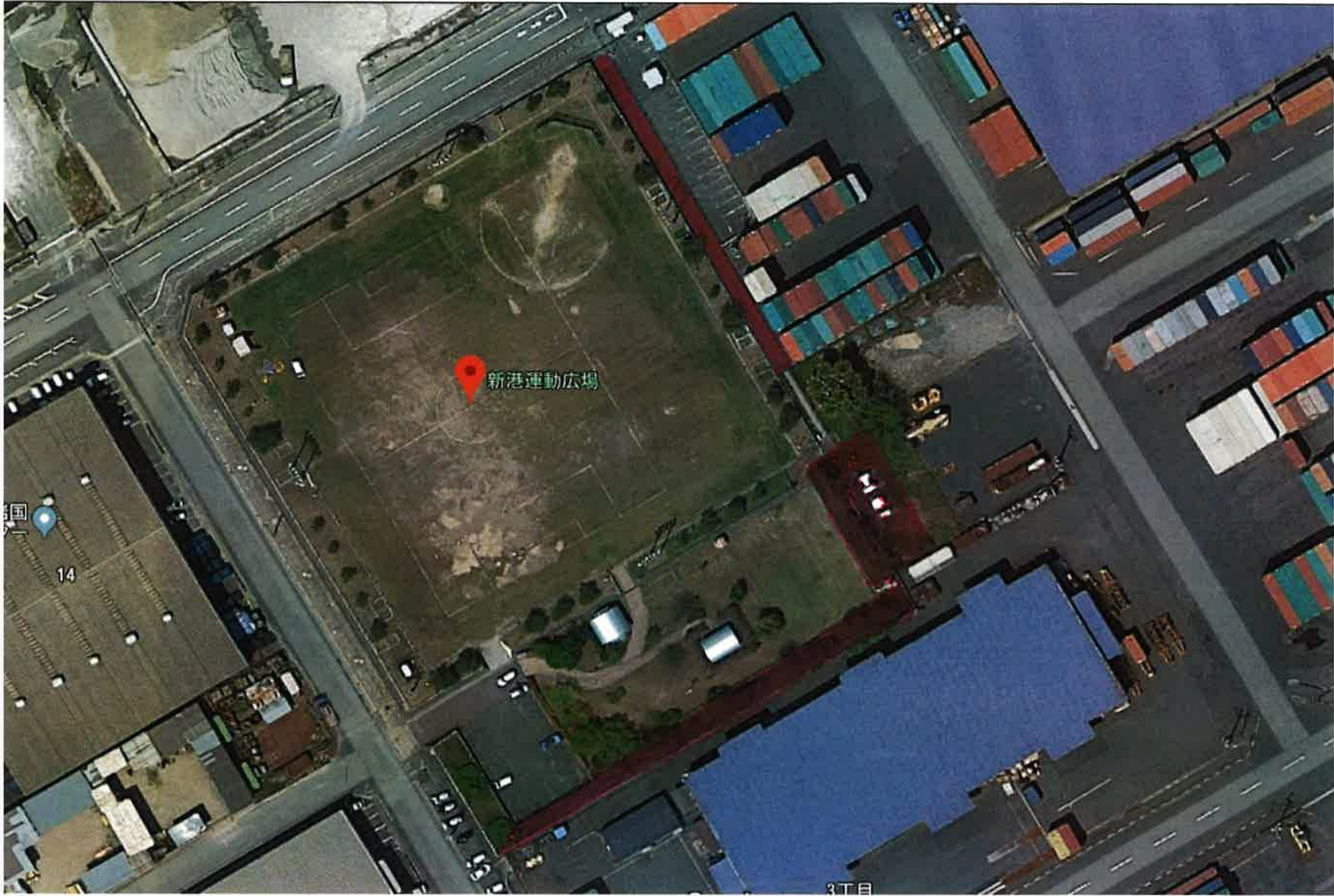
新港運動広場周辺