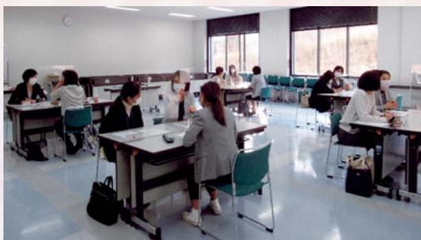
〔昨年の座談会の様子〕