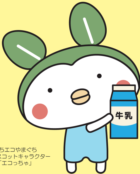
ぶちエコやまぐち 啓発マスコットキャラクター 「エコっちゃん」