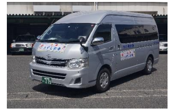
デマンド型乗合タクシー