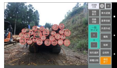
スマート林業（木材検収システム）