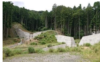
土砂災害防止施設