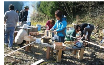
地域資源を活かした交流