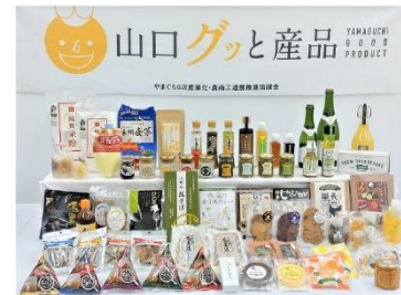
6次産業化・農商工連携の取組