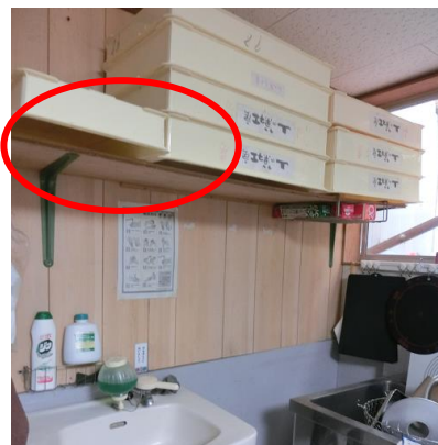
手を洗う度に洗面台上の棚板が頭に当たると腰痛をかかめていましたが・・・