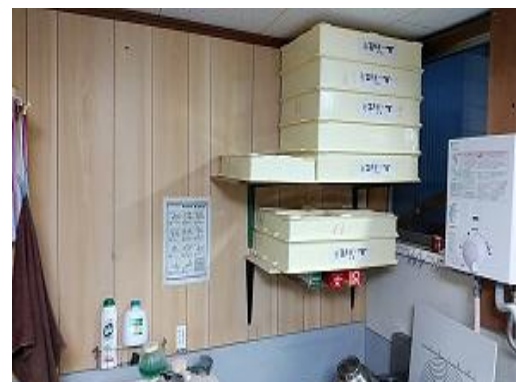
棚板を短くして、二段にすることで安全に作業ができる空間ができました。