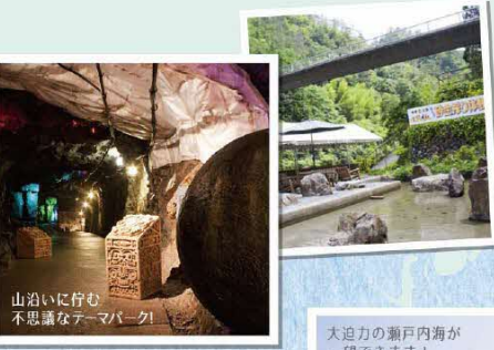
山沿いに佇む不思議なアーマー