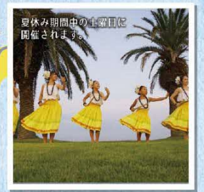
周防大島サタデーフラ