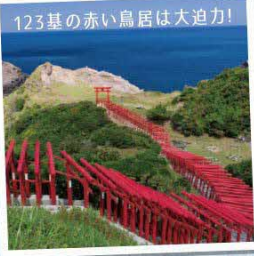
123基の赤い鳥居は大迫力!