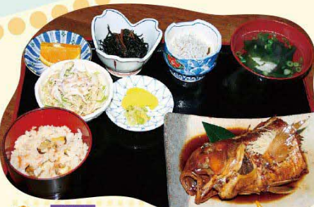
29 萩市 つばきの館