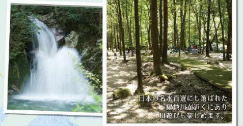
寂地峡キャンプ場