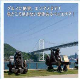
関門海峡 (みもすそ川公園)