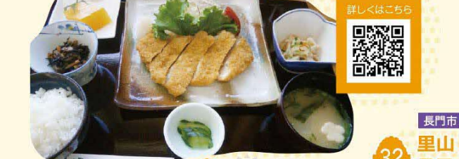
30 萩市 むつみキッチンばあーば

「土地の恵みを活かした食づくり」を目指して、農家レストラン、お弁当製造、直販所の運営を行っています。