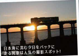
日本海に沈む夕日をバックに走る列車は人気の撮影スポット!