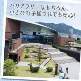
市立しものせき水族館海響館