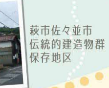
萩市佐々並市伝統的建造物群保存地区