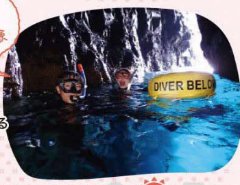
44 阿武町 GI Paddlers

シーカヤック体験は、洞窟を探検したり、島々を巡ったりと、ワクワク・ドキドキがいっぱいです。