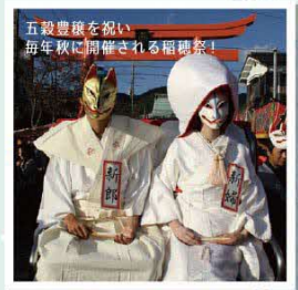
稲穂祭のきつねの嫁入り