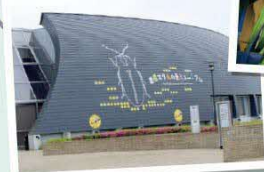
豊田ホテルの里ミュージアム