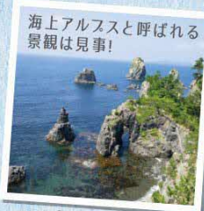
海上アルストと呼ばれる景観は見事!