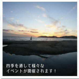
四季を通して様々なイベントが開催されます！