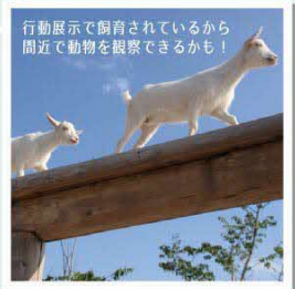
周南市徳山動物園