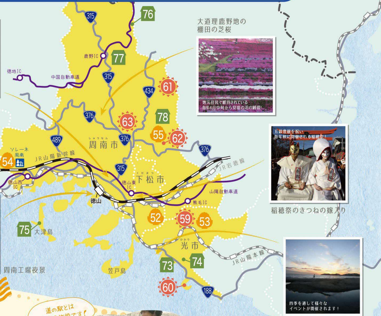
大道理鹿野地の棚田の芝桜