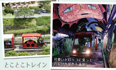
とことトトレイン