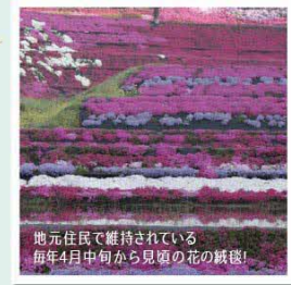
地元住民で維持されている毎年4月中旬から見頃の花の絨毯！