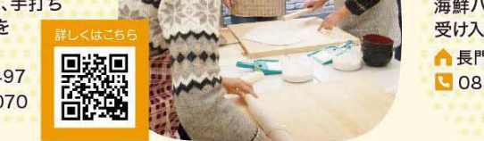
32 長門市 里山ステーション依山

地域交流の拠点施設です。第2日曜は、野菜、手打ちそばと石窯ピザを販売しています。