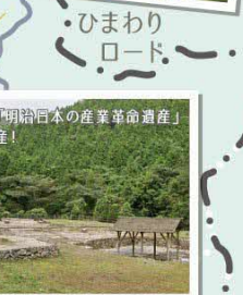
世界遺産「明治日本の産業革命遺産」の構成資産!