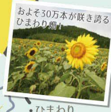
およそ30万本が咲き誇るひまわり畑!