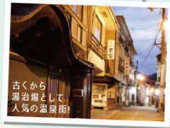
古くから湯治場として人気の温泉街!