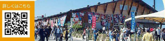
28 萩市 道の駅「萩一まーと」

地域の新鮮な海山の幸を取り揃えた店舗が軒を連ねる「公設市場スタイル」の道の駅です。