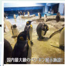
国内最大級のペンギン展示施設!