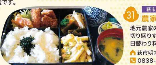
31 萩市 農家れすとらん つつじ亭

地元農家のお母さんグループが切り盛りするあったかレストラン。日替わり料理が大人気です。