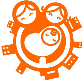
やまぐち子育て応援企業

県では、男女がともに働きながら安心して子どもを育てることができる雇用環境づくりの推進を宣言する事業者を「やまぐち子育て応援企業宣言制度」により応援します。