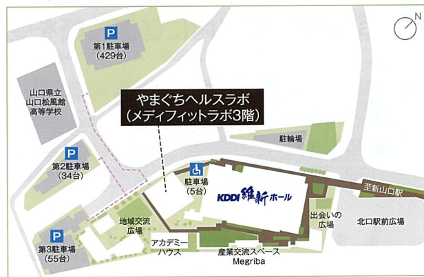
KDDI維新ホール(山口市産業交流拠点施設) / 山口県山口市小郡令和一丁目1番1号