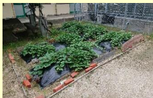
校内野菜育成活動（SDGs取組）