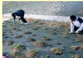
芝桜プロジェクト