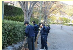
永源山清掃ボランティア