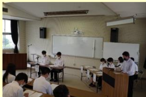
生徒総会での行動宣言