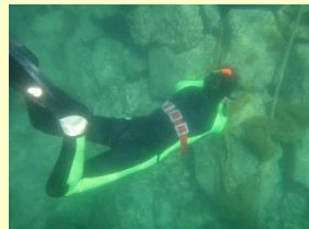
ウニの食害に関する調査