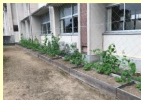
緑のカーテンの制作