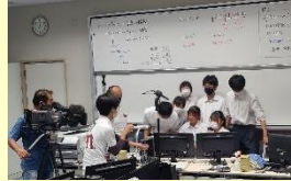
アジア太平洋ジオパーク大会