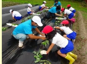
近隣小学校との連携