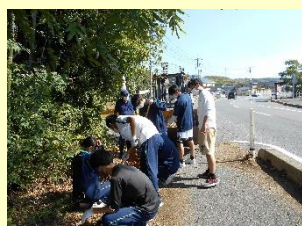
有志清掃ボランティア