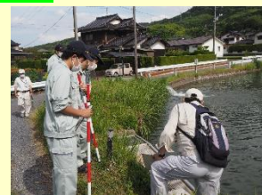
ため池の安全点検