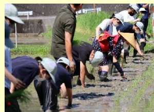
田植え行事「さのぼり」