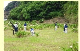
ハマユウの保護活動