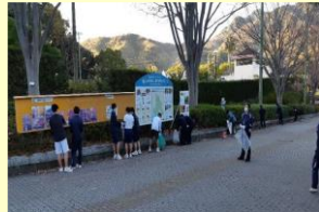
地球環境ミーティング（清掃活動）