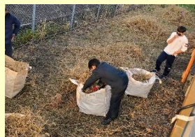
最寄り駅の清掃活動