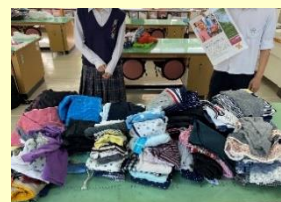
“服のチカラ”プロジェクト