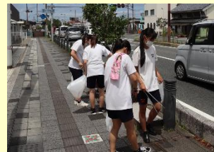
近隣高校合同市内清掃活動