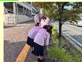
「幸せ清掃隊」による清掃活動