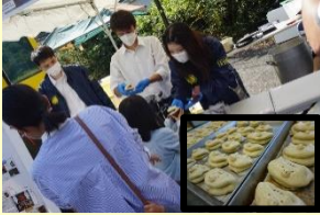
「ししまん」の試食会