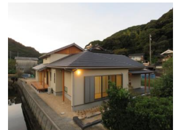
長門市産木材利用住宅

県産木材の新たな需要創出に向け、民間・公共建築物の木造化、内装木質化を進めるとともに、幅広い啓発や理解醸成を通じて、県産木材の利用促進を図ります。