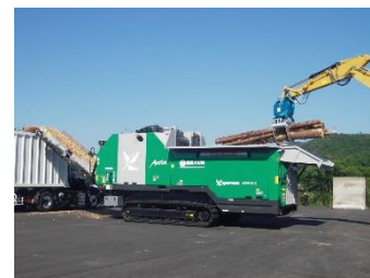
県西部森林バイオマスセンター

エリートツリーや早生樹を活用した主伐一再生林一貫作業等による森林の若返り、非住宅建築物等における木材利用の促進、森林バイオマスの供給体制整備など、森林資源の循環利用、エネルギー利用を推進します。