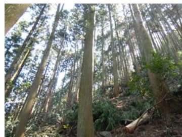
間伐による適切な森林整備