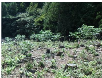
早生樹センダンの植栽

森林の有する生物多様性や土砂災害防止、水源かん養などの多面的機能が維持・発揮されるよう、間伐等による適切な森林整備を推進します。