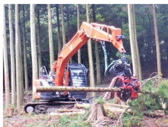
高性能林業機械の活用

建設業等異業種の林業への新規参入支援など、新たな林業事業体の育成による木材生産体制の強化を図ります。