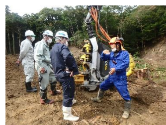
異業種向け木材生産実践研修