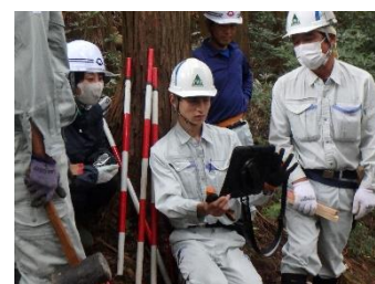
アプリを使用した資源調査

各種スマート林業技術の現場実装に向けた取組等により、効率的な木材生産・供給体制を構築します。