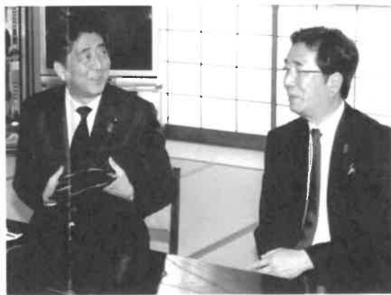
在りし日の安倍晋三元総理と懇談する島田教明

3期12年目を迎え、着実に力をつけられています。県議選に立候補された理由は何ですか。