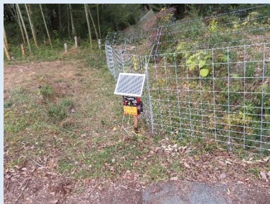
[イノシシ・サル侵入防止柵]