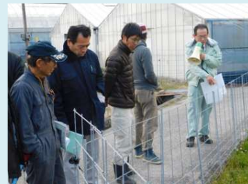
地域ぐるみで行う鳥獣被害 防止活動現地見学会