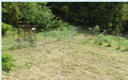
平成30年度に設置した 侵入防止柵