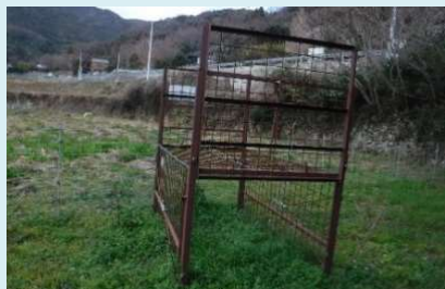
平成29年度に設置した イノシシ捕獲用箱わな