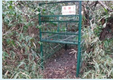
令和元年度に設置した イノシシ捕獲用箱わな