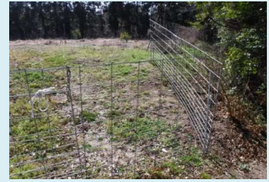
令和元年度に設置した侵入防止柵