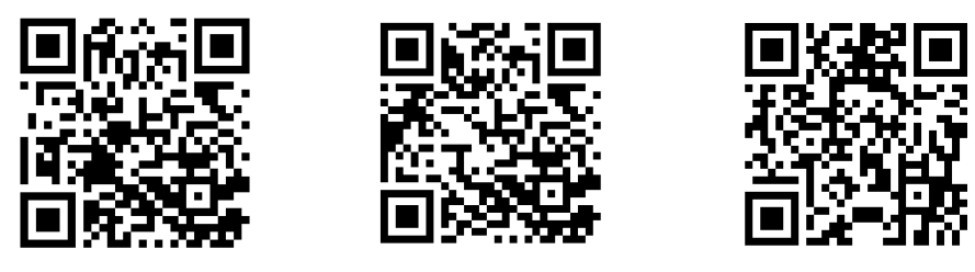
ワークショップで作れるアニメ作品例 (Scratchサイト表示)