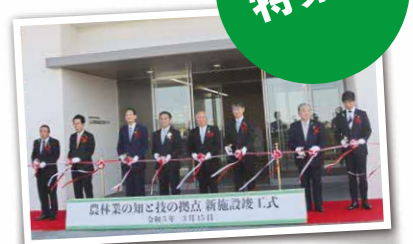
3月15日に竣工式を開催

山口県の農林業には、担い手の減少・高齢化や、産地間競争の激化、急速に進化する先端技術への対応など、さまざまな課題があります。県では、これらの課題に的確に対応するため、山口市の農業試験場と林業指導センターを防府市の農業大学校に移転・統合し、高度な技術を持つ即戦力人材の育成と、先端技術の開発に一体的に取り組む「農林業の知と技の拠点」を整備しました。県民に愛され活用される「知と技の拠点」として、新たな取り組みを力強く進めていきます。