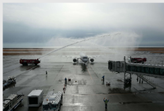
山口宇部空港に到着した韓国の飛行機