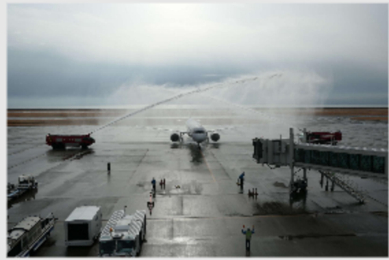
야마구치우베공항에 도착한 한국 비행기