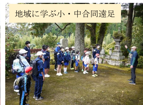
地域に学ぶ小・中合同遠足

5年の総合学習で地域の支援の下、畑作りから販売まで様々な視点から地域の産業について学びました。