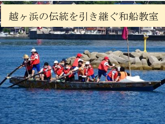
越ヶ浜の伝統を引き継ぐ和船教室