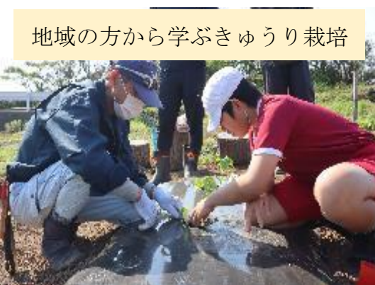
地域の方から学ぶきゅうり栽培