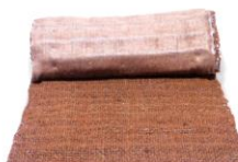
グリーンフォーマットメガタイプ