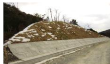
グリーンフォーマットT-50

山林の整備で発生した間伐材を木毛状に加工し、植生基材マットの原材料として再生利用した製品です。間伐材は天然由来の循環資源であり、安全面での懸念がありません。