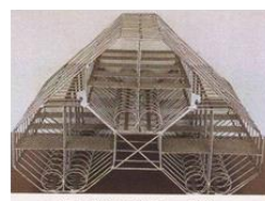
加工製品 (魚 礁)