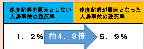
【速度超過が原因となった事故の致死率※1】（令和5年中）