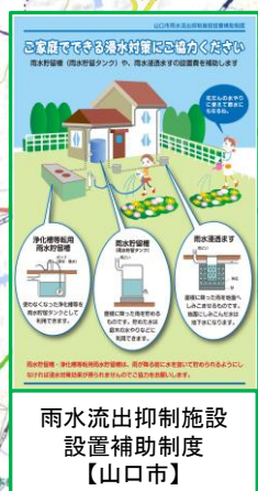
雨水流出抑制施設 設置補助制度 【山口市】