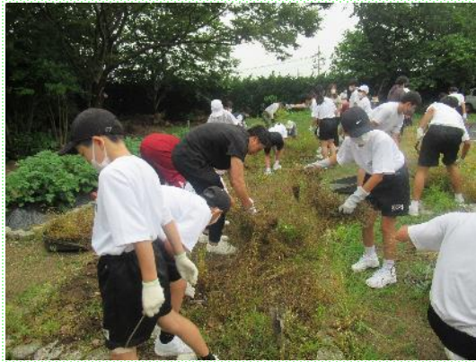
6月・11月クリーンタイム（地域の方々と協働）