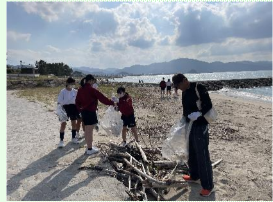
10月さわやか海岸清掃（地域の方々と協働）