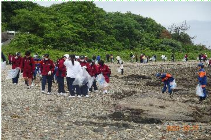
ボランティア清掃