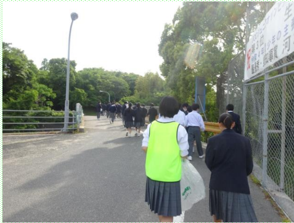
クリーン作戦に出かける様子