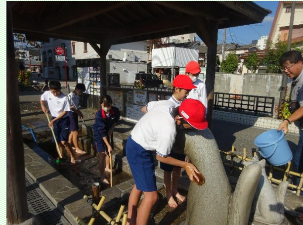
2学期 足湯での小学生との共同作業