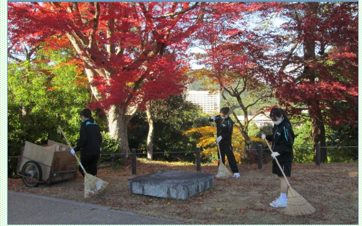
地域での清掃活動（白石クリーンプロジェクト）