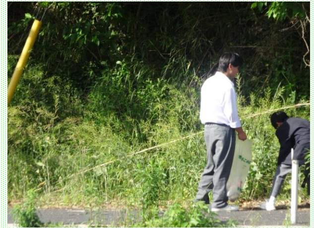
クリーン作戦のごみ拾いの様子