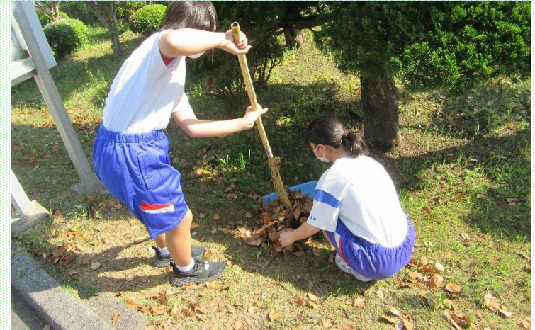
ボランティア美化活動