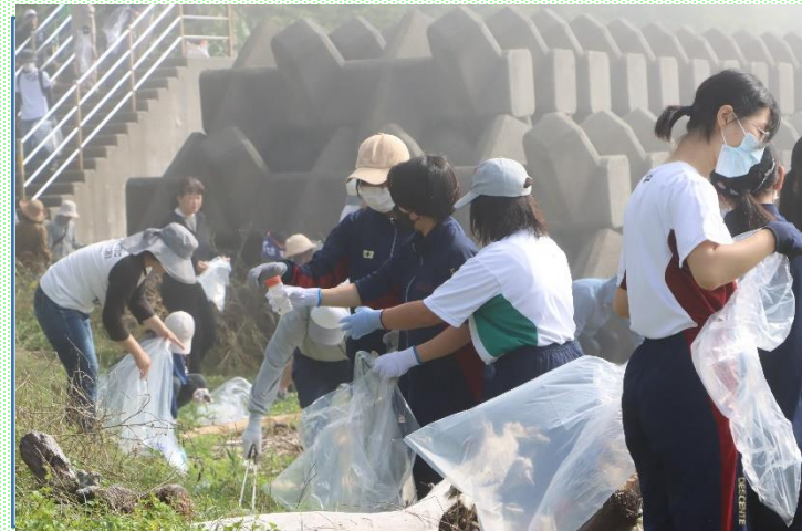
常盤海岸清掃、空港公園の除草作業