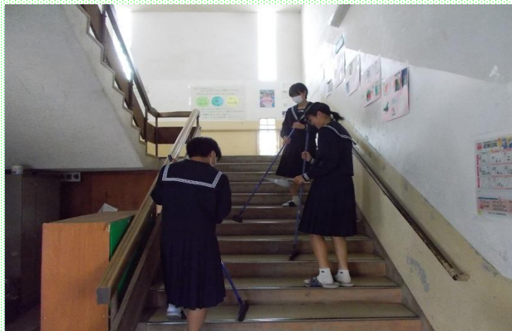
ボランティアによる昼休憩の校内清掃活動