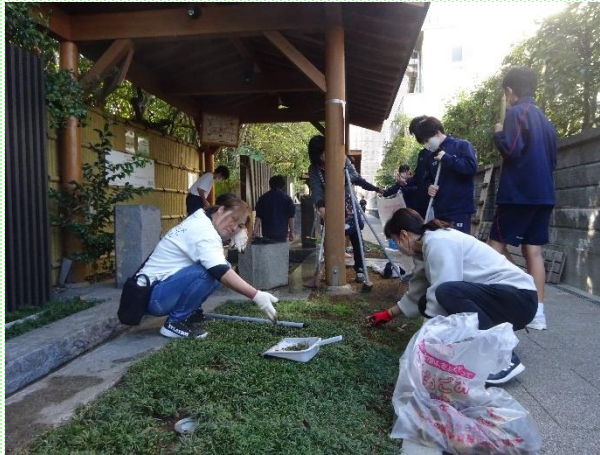
2学期 保護者の方といっしょにごみ拾い