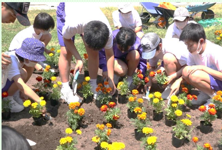
花の植え付けの様子