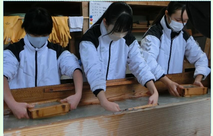
地域資源を活用した和紙づくり