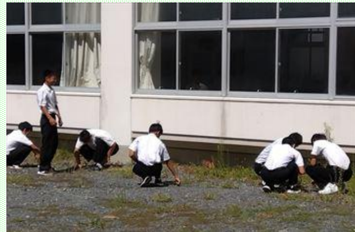
毎週水曜日の昼休みに行っている、有志による環境整備