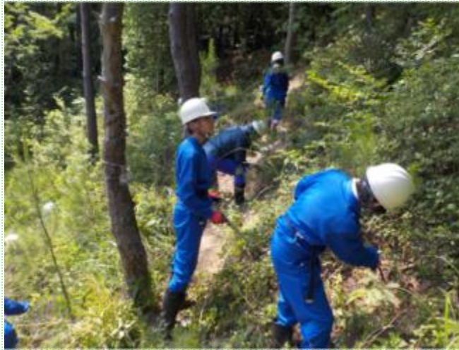
学校林の下草の除伐