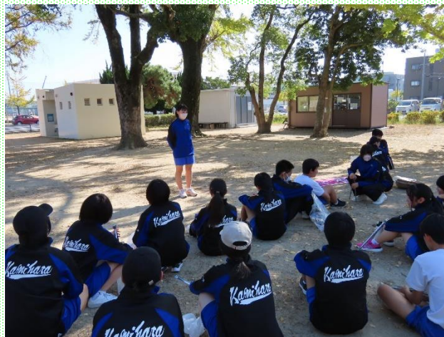
全校生徒による地域清掃活動