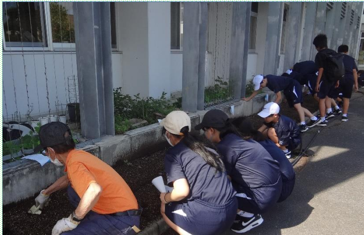
花壇の苗植え・緑のカーテンづくり