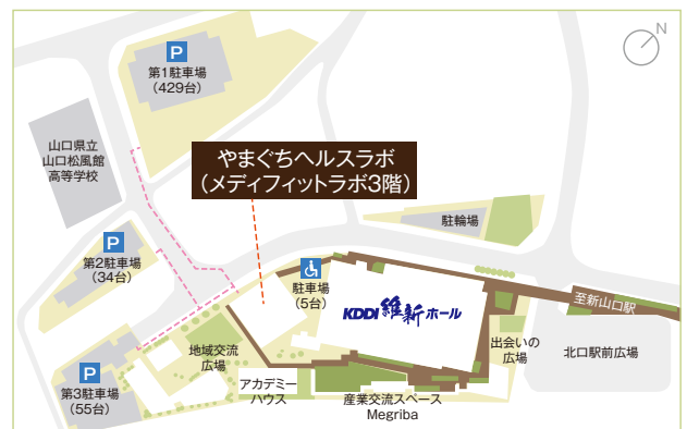
KDDI維新ホール(山口県産業交流拠点施設) / 山口県小郡市令和一丁目1番1号