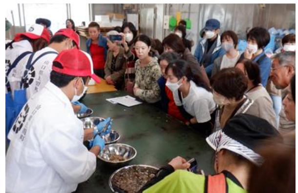
産地見学ツアーの開催