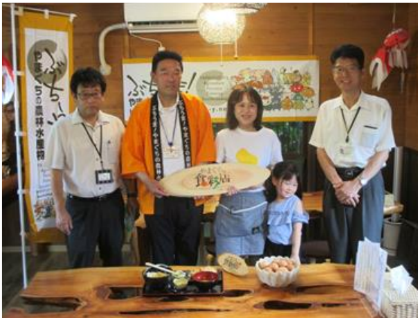
やまぐち食彩店の開設