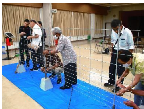
イノシシ防護柵メンテナンス研修