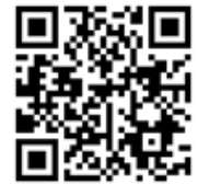
地産・地消推進拠点のPR