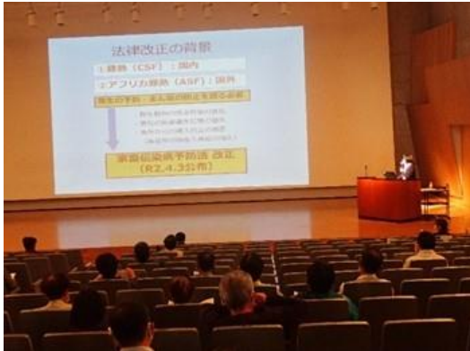
飼養衛生管理基準研修会