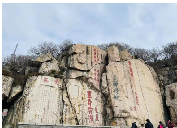
封禪記念碑の「紀泰山銘」

て、「禪」とは泰山の麓の丘に壇を設けて地を祭ることです。封禪で即位または偉業を天に報告し、天地の恩に感謝し、皇帝は天命を受けている人として、世を治めることを宣言するという意味もありました。唐・宋時代の対外交流の拡大に伴