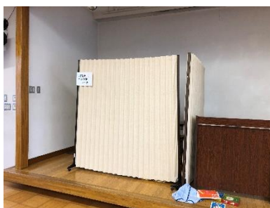
[おむつ替え/授乳室（会場内）]