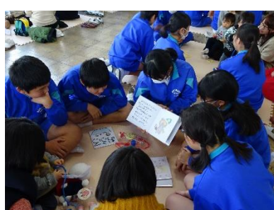
[手作り絵本の読み聞かせ]