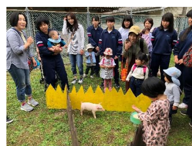
[動物との触れ合い体験]