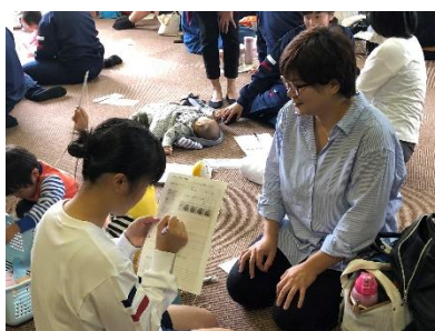
[子育て体験の聞き取り調査]