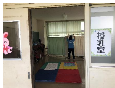
[おむつ替え/授乳室（別室）]