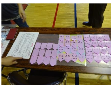
[受付（名簿/名札シール）] [会場（マット/おもちゃ/壁飾り）]