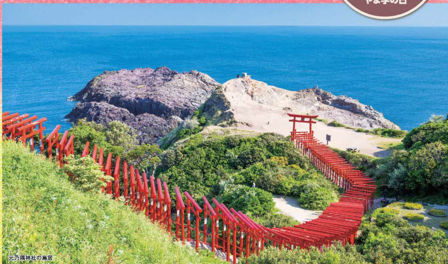
元乃隅神社の鳥居