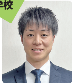
山口県立 周防大島高等学校 安下庄校舎