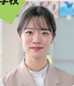
山口市立 小郡南小学校