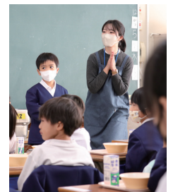
【撮影協力】 山口市立小郡南小学校