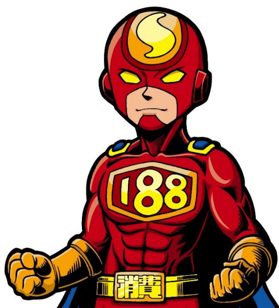
消費者教育推進大使 188マン