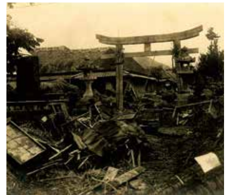
右田村玉祖神社前ノ惨状