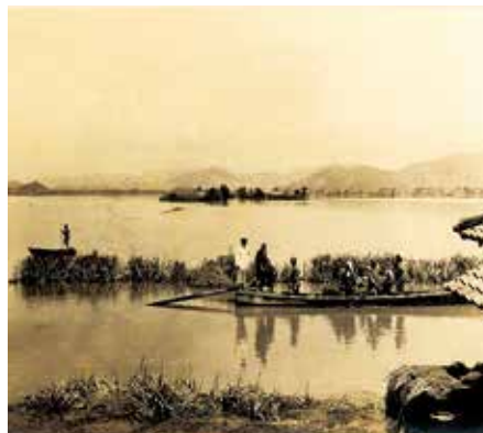
西浦村新開作浸水状況