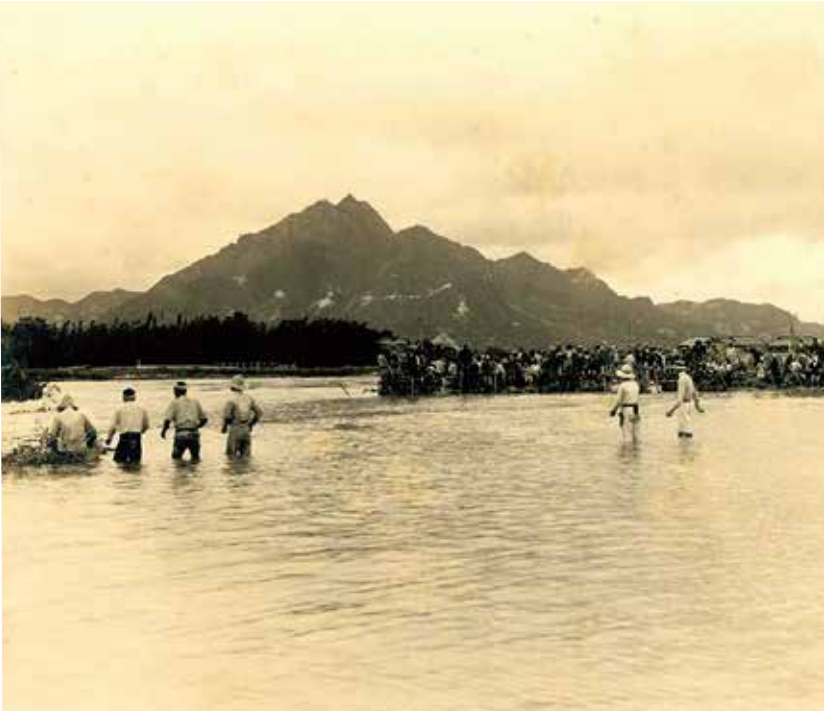
防府町字古曽原新橋下堤防決潰箇所 (山口県文書館所蔵)