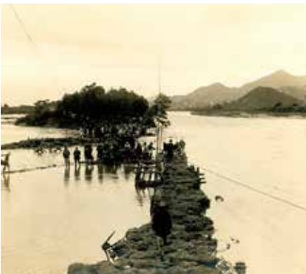
防府町字古曽原新橋下堤防決潰箇所