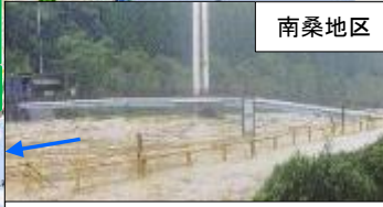
平成11年9月台風18号 出水状況