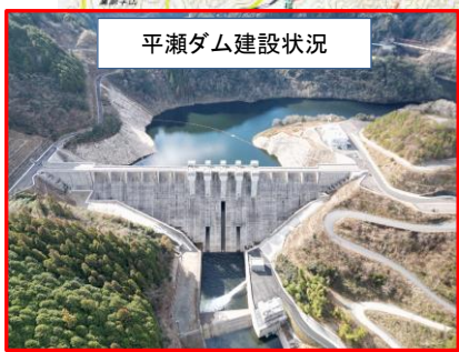
平瀬ダム建設状況