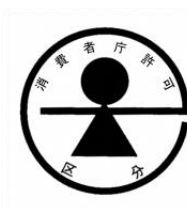
7093 (b) 特別用途食品の標識