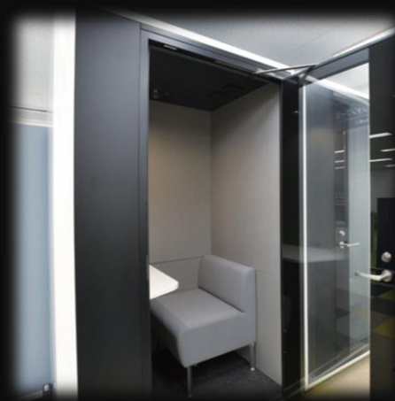
WEB会議等用防音ブース