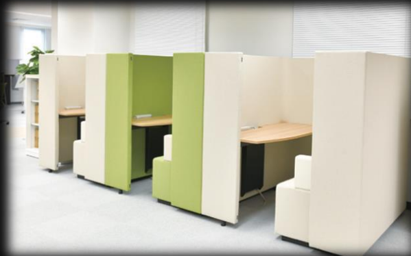
パーソナルデスク