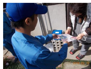
〈事業者による見守り活動〉