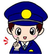
発生件数（警察署別）