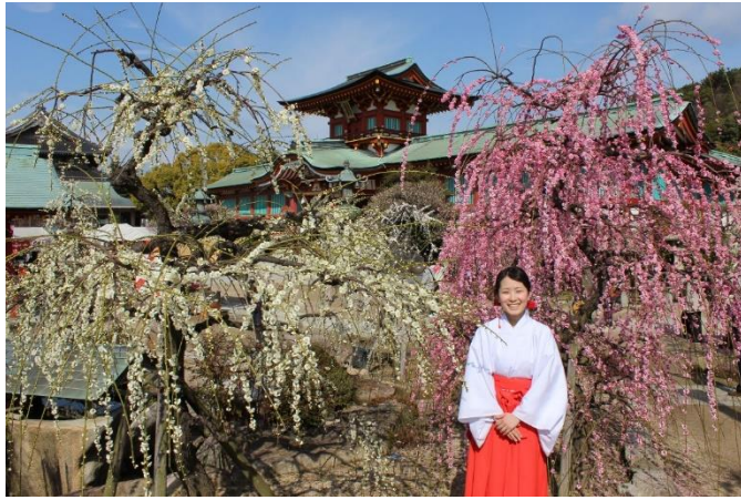
매화꽃 ( 2월 중순 ~ 3월 상순 )