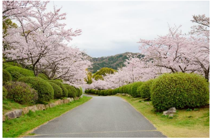
벚꽃 ( 3월 하순 ~ 4월 상순 )