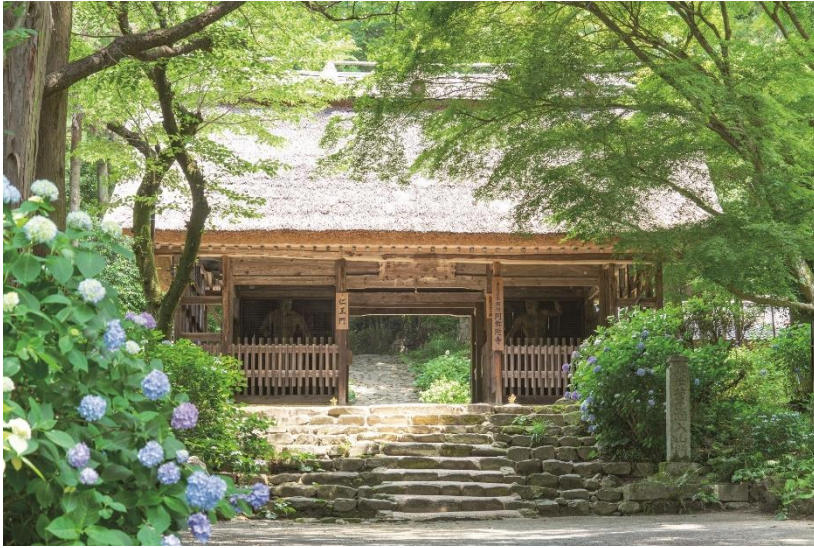
【도다이지 별원 아미다지】 東大寺別院阿弥陀寺