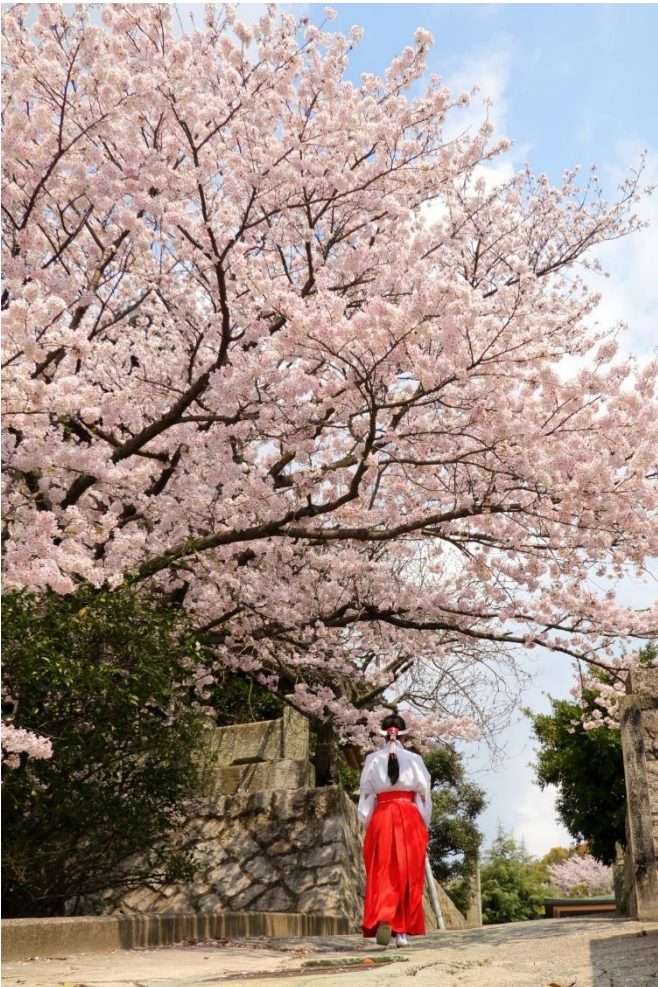
벚꽃 ( 3월 하순 ~ 4월 상순 )