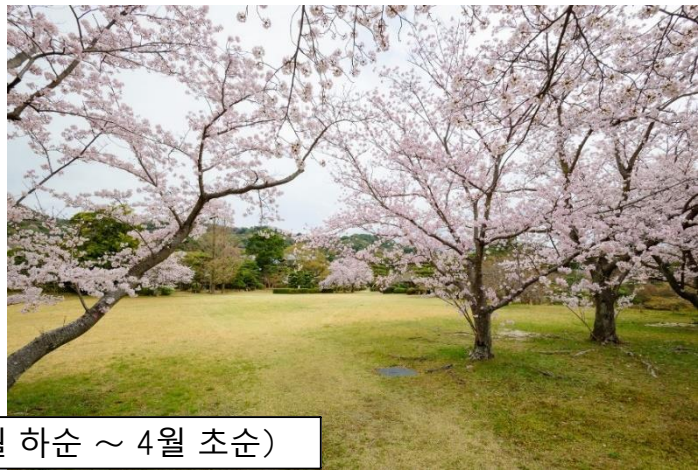
벚꽃 절정시기 (3월 하순 ~ 4월 초순)