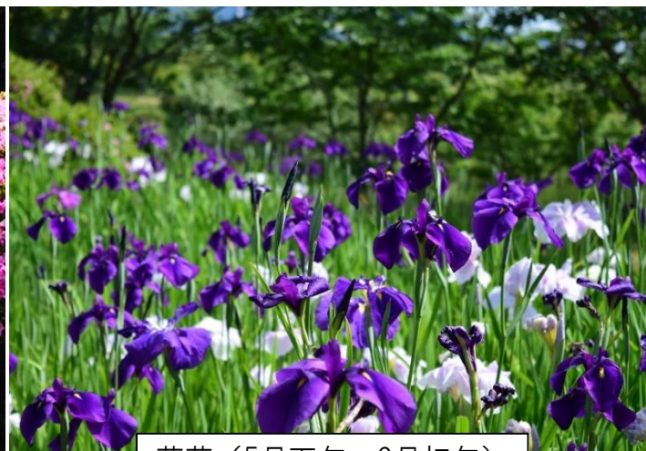
菖蒲（5月下旬～6月初旬）