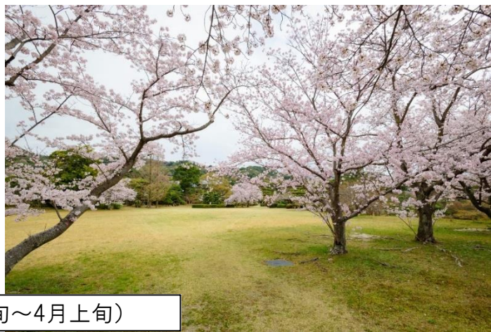
櫻花（3月下旬～4月上旬）