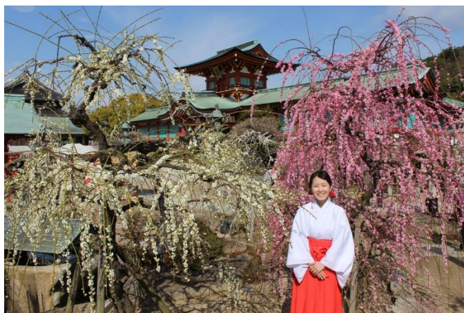
梅花（ 2 月中旬～ 3 月上旬）