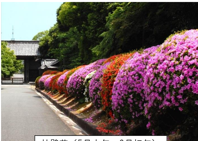
杜鹃花（5月中旬～6月初旬）