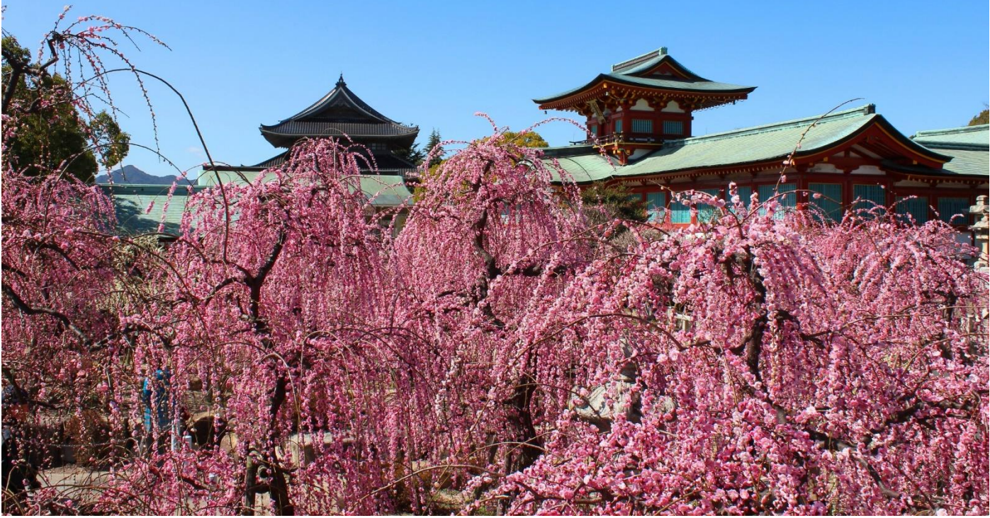
梅花（2月中旬～3月中旬）