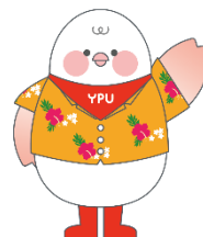
公式マスコットキャラクター 「わいびよ」

〒753-8502 山口市桜島6丁目2-1 将来構想推進局 附属高等学校設置準備室 担当：尾本 TEL：083-929-6513 FAX：083-929-6515 Email：fuzoku@yp4.yamaguchi-pu.ac.jp