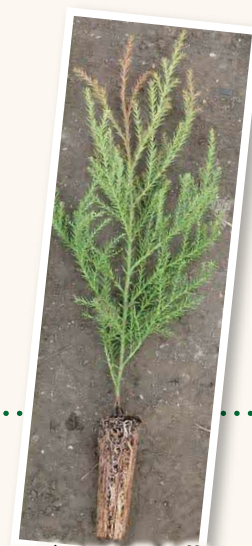
スギのコンテナ苗